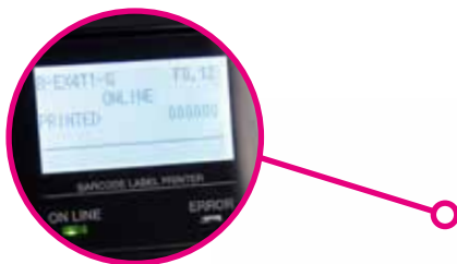
Panneau de configuration convivial pour une utilisation facile

L'écran graphique LCD est une source d'aide intuitive qui facilite l'utilisation et guide les utilisateurs même novices dans les actions correctives à effectuer en cas de problème, réduisant ainsi les besoins de formation des utilisateurs.